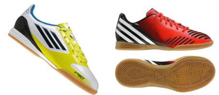
Abbildung links: ein Adidas Indoor Modell zum Vorzugspreis von nur 30 €...

Für den normalen Sportunterricht benötigen alle DFI Schüler einen Hallenschuh. Wir haben aktuell folgende Angebote für unsere Jungs im Programm: